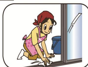
窓の結露はまめにふき取り掃除する