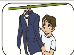
ぬれた革靴や制服はすぐに乾かす